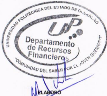
ELABORÓ C.P. CARLOS EDUARDO BELLO VILLALVA JEFE DE RECURSOS FINANCIEROS

"Bajo protesta de decir verdad declaramos que los Estados Financieros y sus notas, son razonablemente correctos y son responsabilidad del emisor". Lo anterior, no será aplicable para la información contable consolidada.